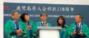
OS DE FUNDAÇÃO DO KAGOSHIMA KENJINKA

最終日の22日、一行はブラジル鹿児島県人会創立105周年記念式典に参加。祝辞、功労者表彰の後は参加者全員で“おはら節”を踊りました。締めくくりにはリオのカーニバルのドラマ演奏とダンスが披露され、会は大盛況のうちに終了しました。その後、鹿児島県費留学生と海外技術研修員OBとの懇談会が開催され、鹿児島大学留学時の思い出や感謝が述べられた後、意見交換を行いました。