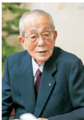
稲盛 和夫 (いなもり かずお) 京セラ名誉会長